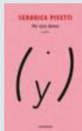
Veronica Pivetti e la cover del suo libro "Per sole donne"