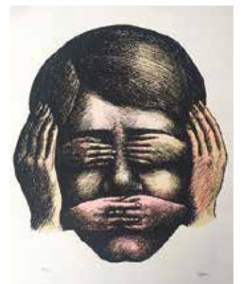
Topor, «Non vedere, non...», 1970

«La principessa Angina», a cura di Carlo Mazza Galanti, con i disegni dell'autore