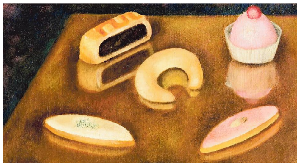
Particolare dell'olio su tela "Pâtisseries" di Leonor Fini, 1929 circa, collezione privata

Al Magazzino 26 dal 26 giugno al 22 agosto una rilettura della personalità dell'artista curata da Marianna Accerboni