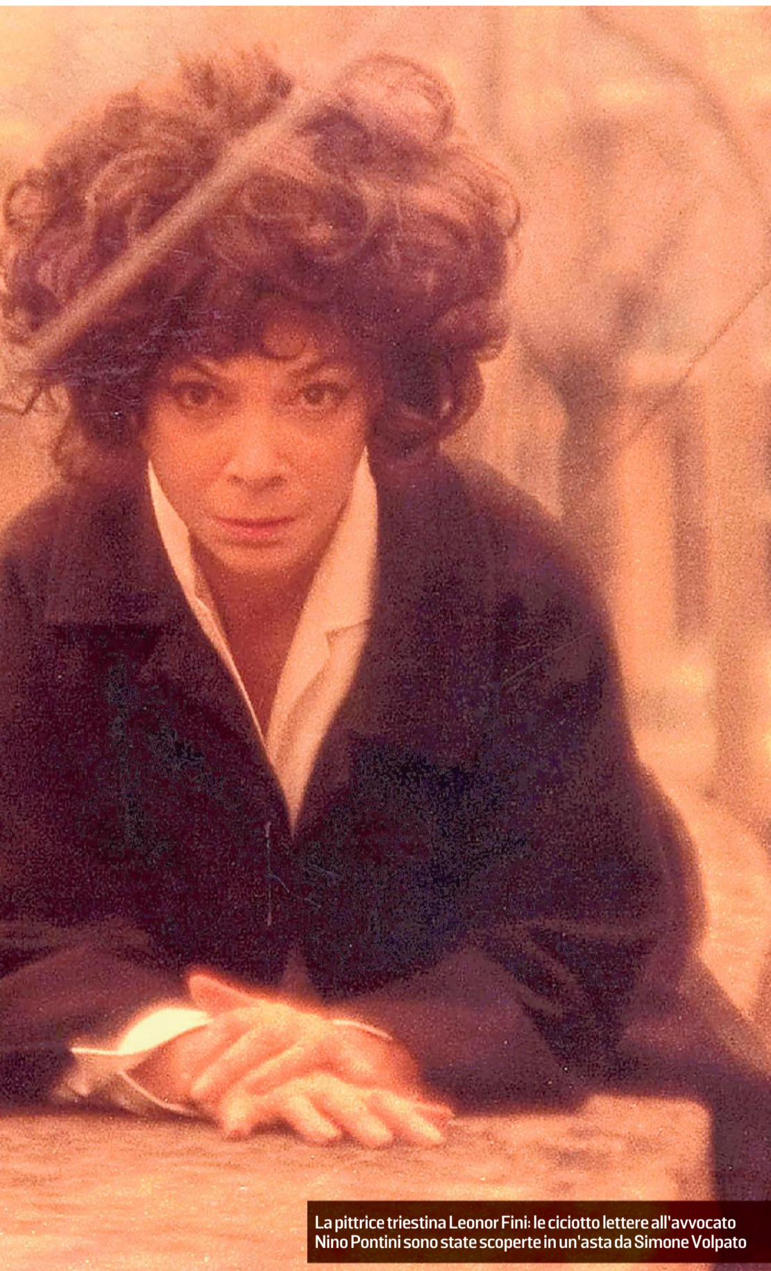
La pittrice triestina Leonor Fini: le ciotole lettere all'avvocato Nino Pontini sono state scoperte in un'asta da Simone Volpato

dall'amnesia (...). Cerco di recuperare qualche filo». Una storia che entra a gamba tesa nel magma liquido dell'interiorità femminile non poteva che partire da una «scrittura convulsa e dolente, ma piena di vita e immaginazione», come l'ha definita Dacia Maraini nella prefazione alla ristampa, «per tornare a farci riflettere sulla condizione femminile». È proprio questa sorta di ruvidità narrativa, che Montale nel '49 paragonò a quella del Joyce di Gente di Dublino, il filo conduttore del romanzo che lascia sul piatto più che risposte, molte scomode domande ancora attuali. Dirà infatti Laudomia Bonanni della sua Cassandra: «La protagonista donna è un po' la protagonista di tutto quello che ho scritto».