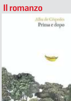
Il romanzo Alba de Céspedes Prima e dopo Clquot 128 pp., 16 euro Il romanzo uscì per la prima volta nel 1955

Non è scontato avere tutte queste informazioni sulla storia creativa ed editoriale di un romanzo, ma in questo caso è possibile grazie a uno studio intenso e dettagliato che la ricercatrice Antonia Virone ha fatto a partire dagli archivi di Alba de Céspedes, confluito in un interessante libro intitolato Tante cose da dire e da scrivere (Pacini, 2019). È bello poter contare su notizie solide dentro cui fantasticare senza tradire la realtà, immaginare la scrittrice nelle esaltazioni, idiosincrasie, nell'atmosfera nera e distorta dei malumori dell'inventiva, nella precisione maniacale del riassetto lessicale. Pare