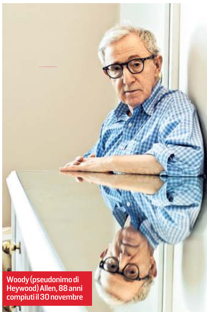
Woody (pseudonimo di Heywood) Allen, 88 anni compiuti il 30 novembre

Da decenni, le definizioni sul suo conto si rincorrono e si sprecano: «il più europeo dei registi americani», «il più sfer-